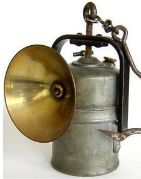
Grubenlampe (ca. 1900 - 1950)