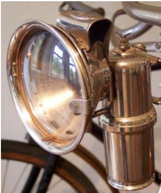
Fahrradleuchte (ca. 1910)